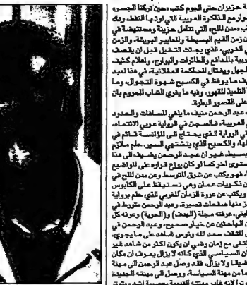
عبد الرحمن منيف

فيها أعلن عن تكليف منيف من قبل الرئيس بشار الأسد. كما أعلن عن تكليف منيف من قبل الرئيس بشار الأسد. كما أعلن عن تكليف منيف من قبل الرئيس بشار الأسد. كما أعلن عن تكليف منيف من قبل الرئيس بشار الأسد. كما أعلن عن تكليف منيف من قبل الرئيس بشار الأسد.